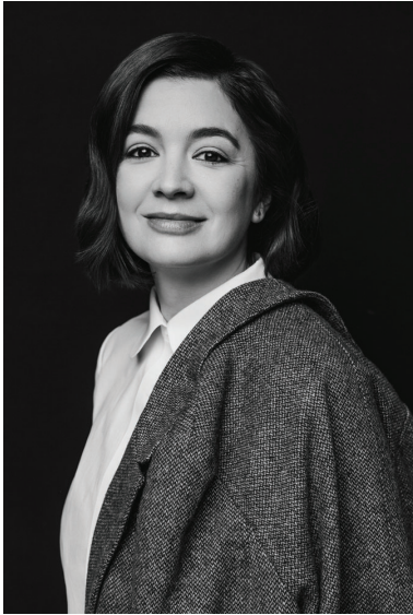
urmăre din pag.3

„La nivelul României, acesta ar trebui să devină un exemplu de bune practici și ar putea fi un model pentru alte proiecte, setând un standard de referință pentru normalitate”