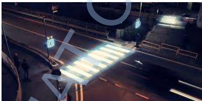
exemplu trecere pietoni semnalizata corespunzator

Analiza noastră reliefează ca zonele de risc definite ca atare și enumerate în cadrul Caietului de sarcini al serviciului de iluminat public al UAT Talmaciu în special trecerile de pietoni de pe DN 7 trebuie să fie luminate corespunzător (vezi foto )